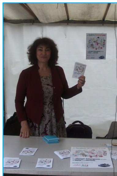
Le Sel de Paris a tenu un stand aux forums des Associations des 4 ème , 9 ème , 10 ème et le 11 ème arrondissements