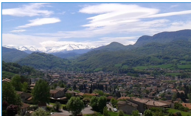
Vallée du Couserans en ARIEGE

dans une vallée aux pieds d'un des plus hauts sommets des Pyrénées, accueille toutes sortes d'écritures différentes, dans la liberté de la découverte ; et peut être un « accouchement » de nos projets d'écriture. Décoller par l'imagination, le jeu, la rêverie..., et se connaître ou faire connaissance par l'écriture.