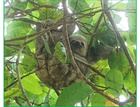
Un paresseux dans un arbre près d'une école primaire

Une formation d'une semaine a été assurée sur place fin septembre avec ces enseignants et un groupe d'élève de la Maison des Lycéens.