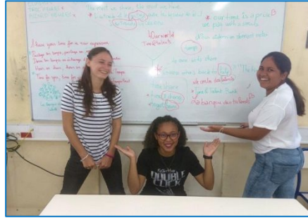
Séance de travail avec des lycéens

Un groupe d'enseignants cherche à développer l'entraide et la solidarité entre les lycéens. Une expérience de monnaie temps a été faite l'an dernier dans une classe.