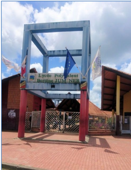
Entrée du lycée

Le lycée polyvalent Bertène Juminer est celui de la seconde ville de Guyane, à l'ouest, en bordure du fleuve Maroni qui trace la frontière avec le pays voisin, le Suriname. La population comporte différentes ethnies qui cohabitent pacifiquement sans pour autant se métisser.